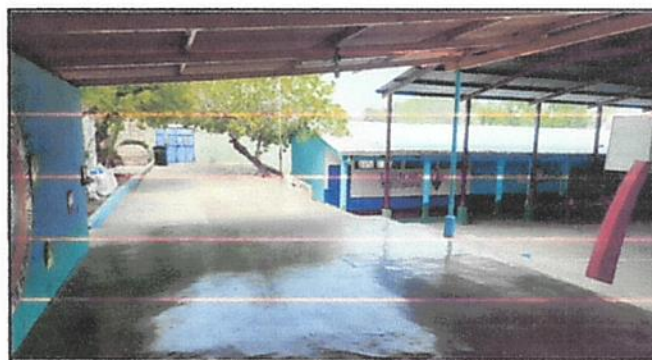
Foto 4: Instalación de tubería principal de pvc de cisterna a los servicios sanitario