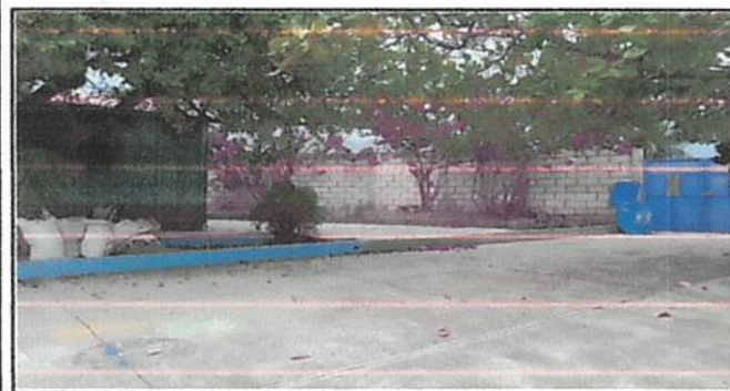
Foto 5: CERRAMIENTO DE MURO PARA EXPANSIÓN DE PUERTAS Y EXTRACCIÓN DE RIPIO