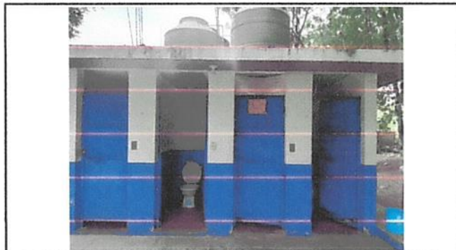
Foto 2: Sustitución de accesorios inodoro (contra llave, tubo de abasto y tanque)